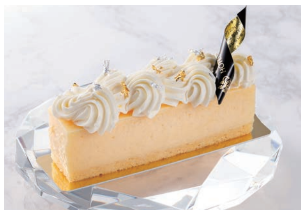
メモリーズ ~チーズが紡ぐ柔らかな思い出~ Baked Cheese Cake

アールグレイが香る濃厚なガナッシュに、甘酸っぱいアプリコットを合わせたチョコレートタルト。ティアラのように華やかな見た目に仕上げました。