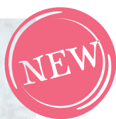
ヴィーナス Tropical Fruits Cake

バナナの生地にマンゴー、パッションフルーツのジュレやクリームを何層にも重ね、ホワイトチョコとココナツのクリームでミルクィなココをプラス。トロピカルな風味がふわっと広がります。