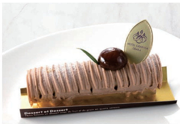
濃厚モンブラン ~新たな至福~

濃厚なバイクドチーズと口どけ滑らかなチーズクリームに、ソテーしたパイナップルをアクセントに忍ばせて。どこか甘酸っぱい記憶を思い起こさせるような優しい味わいです。