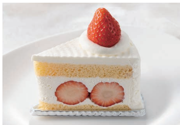
至福のショートケーキ

3種のマロンクリームと軽やかな生クリームを合わせた濃厚な味わい。ムースや生地にも栗を使用した贅沢な一品です。