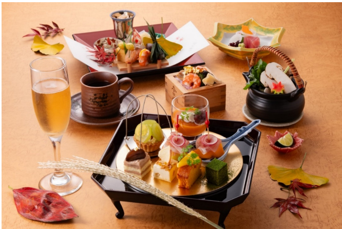
和のいろどり八寸 秋のランチ&スイーツ

また、平日の13時30分以降のご予約に限り、先着2名様限定で個室にて本商品をご利用いただける個室確約プランもございます。優雅で重厚感のある空間で、ゆったりとお食事をお楽しみください。