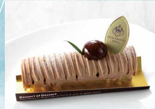
濃厚モンブラン ~新たな至福~

カステラのようなふんわり柔らかいスポンジに、ミルキーで濃厚な味わいの生クリームを合わせます。優しい甘さと苺の酸味の絶妙なバランスに仕上げました。