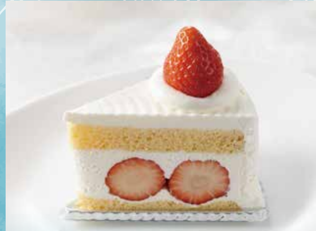
至福のショートケーキ

甘酸っぱいフランボワーズや香ばしいピスタチオ、上品なバニラや滑らかなガナッシュなど、幾つもの層が織りなすハーモニーをお楽しみください。