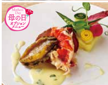
オマール海老と鮑 柑橘風味のバターソース