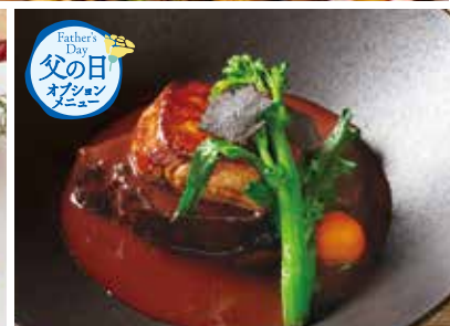
国産牛ほほ肉の赤ワイン煮込みと フォアグラのロッシューニ風