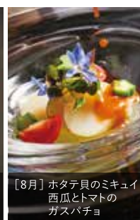
[8月] ホタテ貝のミキュイ 西瓜とトマトの ガスパチョ