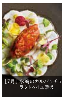
[7月] 水蛸のカルパッチョ ラタトゥイユ添え