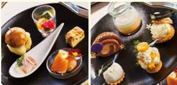
※8・9月はシャインマスカット