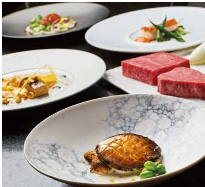
※写真は7月の季ディナーです *Photos are of KOYOMI Dinner(July)